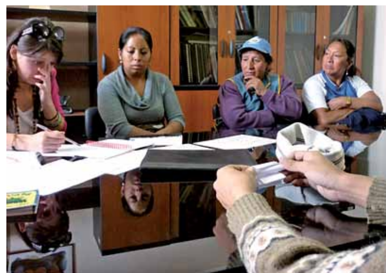
El funcionamiento de esta campaña es monitoreado e involucra a la comunidad que recicla por un planeta más limpio y una universidad más agradable.

En esta reunión se reconocieron las dificultades que las señoras identifican en sus labores de reciclaje y se distribuyeron las facultades donde trabajarán en adelante.